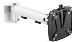
SlatWall Tragarm Artikelnummer: 962+0119+004

Hochwertiger Monitortragarm für die Befestigung an einer Organisationswand, Befestigung von Flachbildschirmen bis 10 kg, Reichweite 300 mm