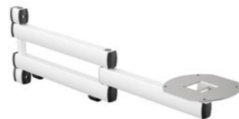
TFC Ablage Faltarm III 330-275 Artikelnummer: 969+3029+000

TFC Ablagearm mit einer Kapazität von max. 15Kg, zur Nutzung mit Tastatur- oder Notebookplatte