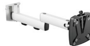
SlatWall Faltarm II Artikelnummer: 964+0119+014

Hochwertiger 2-teiliger Monitortragarm für die Befestigung eines Monitors an einer Organisationswand, Befestigung von Flachbildschirmen bis 10 kg, Reichweite 445 mm