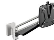
SlatWall Clu Arm I Artikelnummer: 990+1079+000

Eleganter 1-teiliger Monitortragarm mit Gasdruckfeder, für Monitore bis ca. 27 Zoll, Monitorbreite ca. 600 mm, Monitorgewicht 2 - 7 kg, Reichweite 314 mm