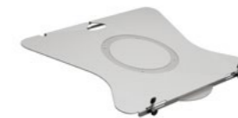
Notebookhalter-Platte Artikelnummer: 795+9169+000

Notebookplatte, 288x404mm, zur Montage an die TFC Ablage Faltarme