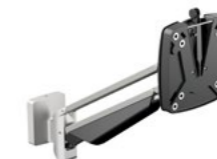
SlatWall Clu Arm I Artikelnummer: 990+1079+000

Eleganter 1-teiliger Monitortragarm mit Gasdruckfeder, für Monitore bis ca. 27 Zoll, Monitorbreite ca. 600 mm, Monitorgewicht 2 - 7 kg, Reichweite 314 mm