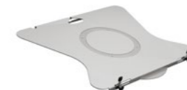
Notebookhalter-Platte Artikelnummer: 795+9169+000

Notebookplatte, 288x404mm, zur Montage an die TFC Ablage Faltarme